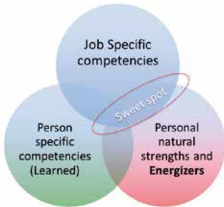
Figuur 1. "The missing link in organisations today."

Tot op de dag van vandaag wordt naar werk gekeken als een match tussen functie-eisen en competenties. Een echt waardevolle en duurzame match ontstaat als sterktes worden meegenomen in dat plaatje. Assessment tools als Strengthscope® van Strengths Partnership en Strengthsfinder 2.0 van Gallup, geven inzicht in de persoonlijke sterktes van een individu, team en leider. Hiermee worden werknemers zich bewust van hun sterktes en worden ze behendig in de toepassing ervan. Want uiteindelijk gaat het erom, dat naast bewustwording van sterktes, er gerichte actie worden ondernomen, met als resultaat ontwikkeling en een significante toename van prestaties en meer voldoening in het werk.