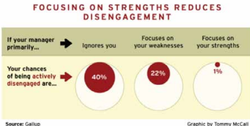
Figuur 2. Focusing on strenghts reduces disengagement (Gallup)

Het lijkt duidelijk dat de positieve focus op het talentpotentieel van medewerkers perspectief biedt op een toename van betrokkenheid, bevoegenheid en prestaties.